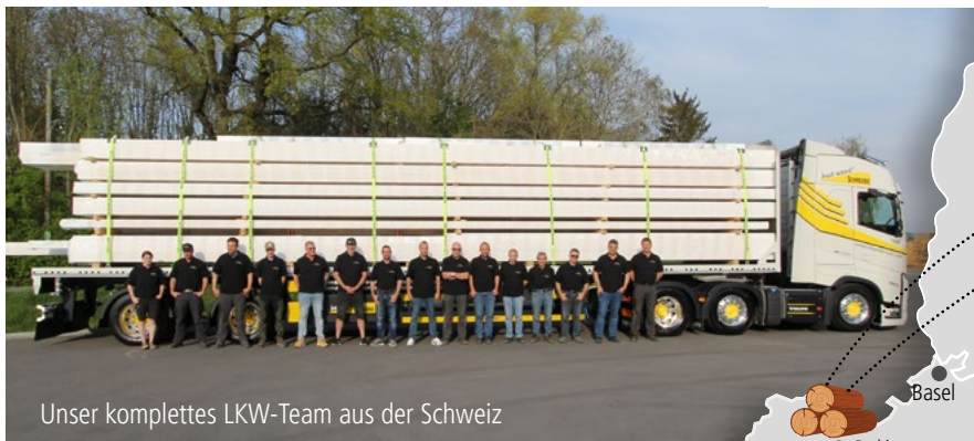
Unser komplettes LKW-Team aus der Schweiz