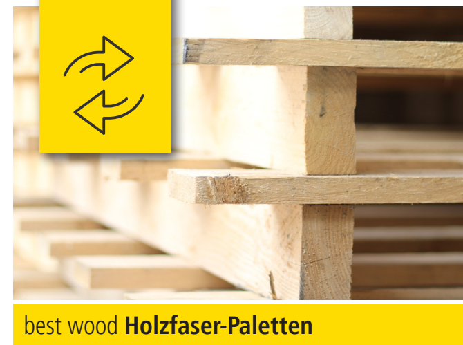
best wood Holzfasern-Paletten

Haben Sie noch funktionsfähige Paletten von einer best wood Holzfasernlieferung oder Europaletten bei sich? Wir nehmen unsere Paletten als auch Europaletten gern bei einer Anlieferung unserer Dämmstoffe mit unseren LKWs wieder zurück!