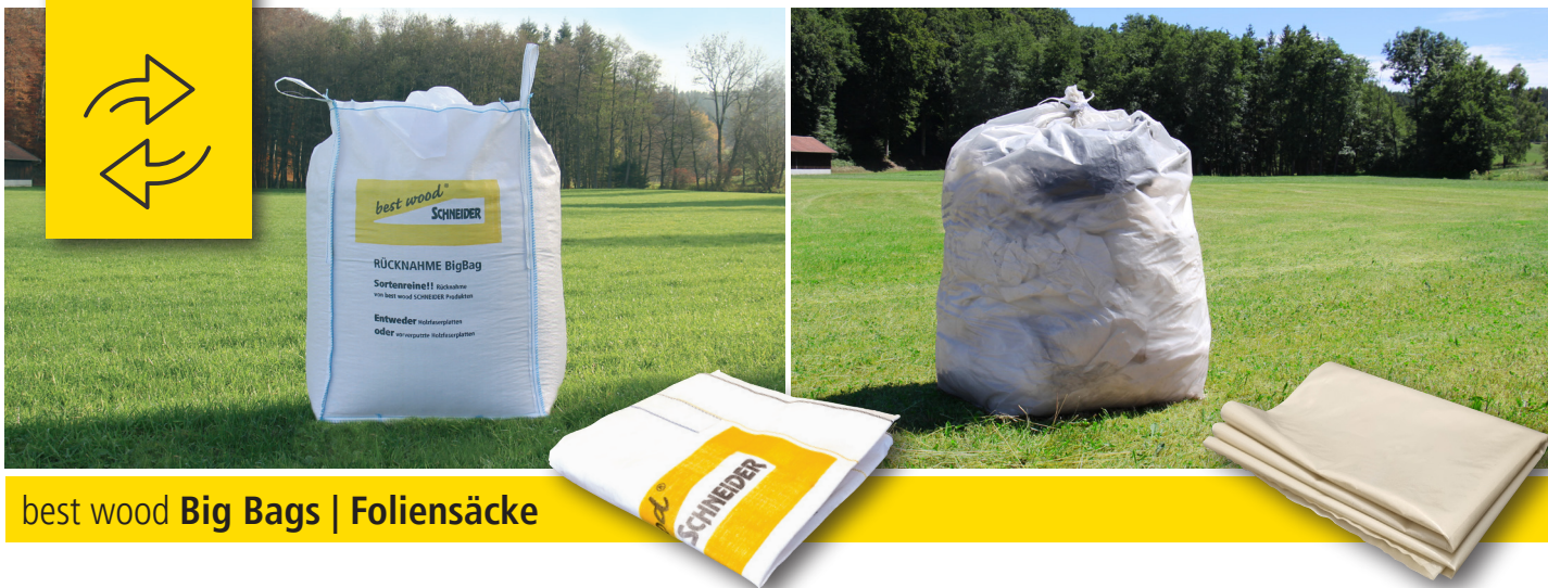
best wood Big Bags | Foliensäcke

Gerne nehmen wir Ihre sortenreinen Holzfasern-Reste im Big Bag und Folien im Foliensack zurück in unser Werk. Jedoch bitten wir Sie, die Rücknahmen vorher bei uns im Büro anzumelden. Nur so können wir einen Rückholauftrag anlegen, Rücknahmen bei der Logistik einplanen und gesetzlichen Vorschriften gerecht werden.