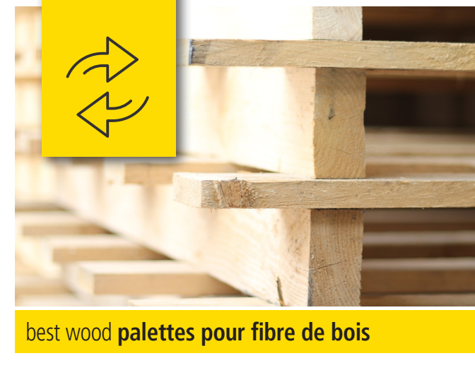
best wood palettes pour fibre de bois

Avez-vous encore de palettes en bon état provenant d'une livraison de fibre de bois best wood ou des euro-palettes ? Nous reprenons volontiers nos palettes ainsi que les euro-palettes lors d'une livraison de nos matériaux isolants avec nos propres camions !