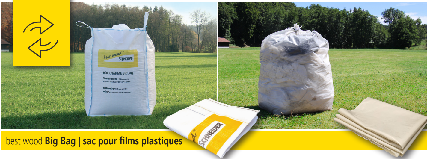
best wood Big Bag | sac pour films plastiques

Nous reprenons volontiers vos chutes de fibre de bois triées au préalable dans les big bags et les films plastiques dans les sacs pour emballages pour les ramener à notre usine. Nous vous prions cependant de faire enregistrer les reprises à l'avance auprès de notre bureau. C'est la seule façon pour pouvoir générer un ordre de reprise, de planifier l'enlèvement par notre service logistique et de répondre aux exigences légales.